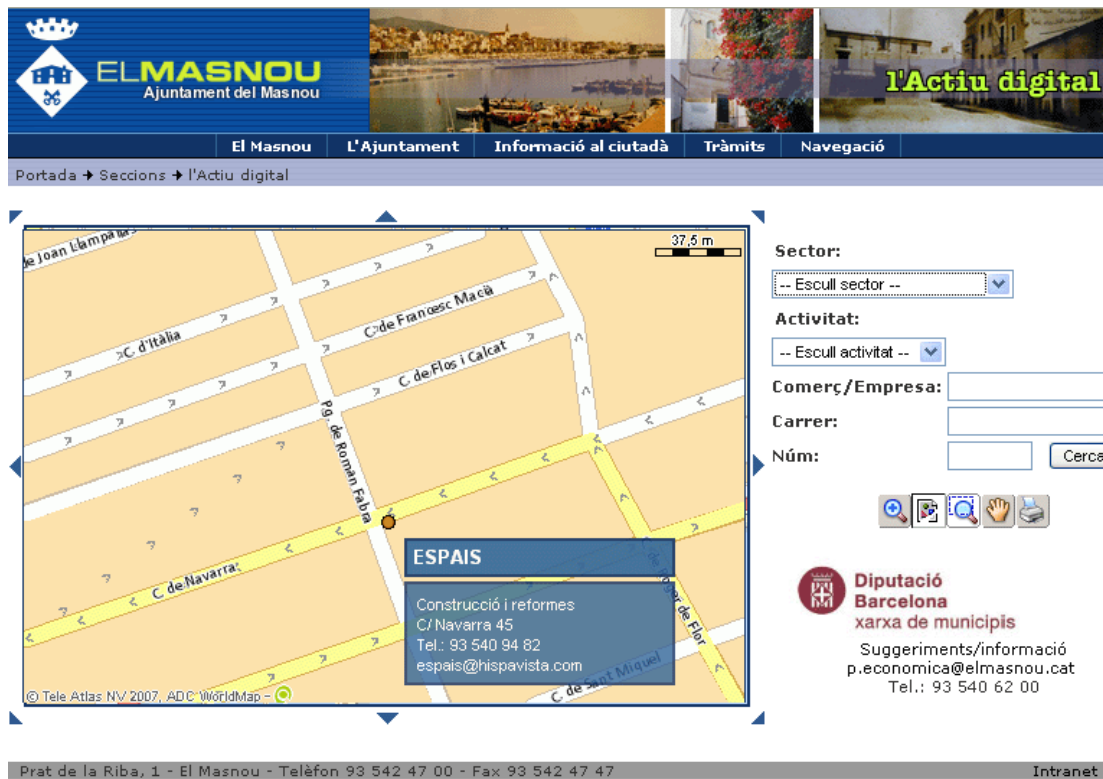
Figura 3. Navegación por la Aplicación tras una búsqueda