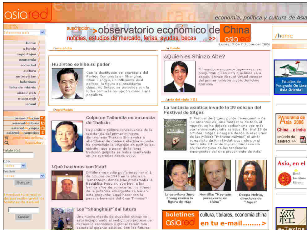
Figura 1. Home de la Web